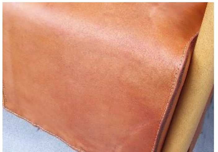
Starke Wasserflecken auf einem Sessel mit Naturllederbezug . Die Flecken liessen sich nicht vollständig entfernen, aber deutlich verbessern.