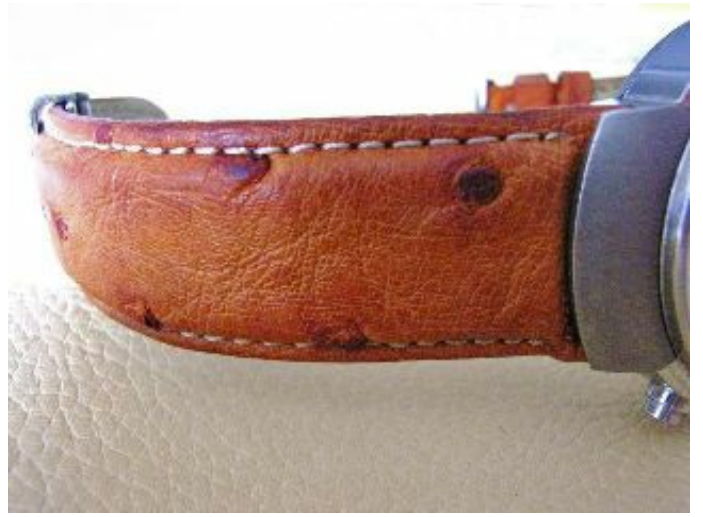
Schweissränder auf einem Straussenleder-Uhrenarmband. Das Ergebnis war unerwartet gut.