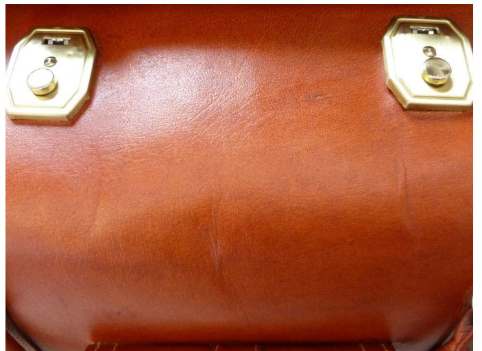
Naturledertasche mit Regenwasserflecken. Das Leder wurde insgesamt etwas dunkler, aber ein schönes Ergebnis.