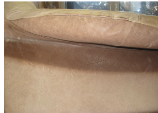
Starke Ausbleichungen auf Anilin- oder Rauleder