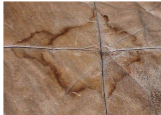
Wasserflecken auf Anilinleder