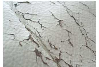
Aufgebrochene, stark versprödete Glattleder

Die Reparatur von Rissen und Brüchen im Leder mit COLOURLOCK Flüssigleder