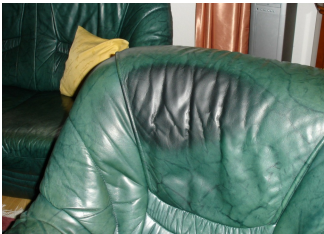
Fettstelle auf Anilinleder

In solchen Fällen immer Rücksprache halten oder Bilder per E-Mail schicken :