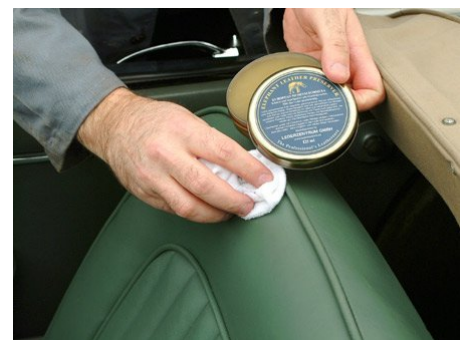
Das COLOURLOCK Elephant Lederfett schützt und imprägniert zusätzlich das Leder von Cabrios.