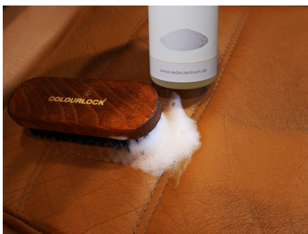
Je nach Verschmutzung mit COLOURLOCK Reiniger mild oder COLOURLOCK Reiniger stark .

Bei Abschürfungen und kleineren Kratzern ist die Farbauffrischung mit unserem COLOURLOCK Leder Fresh möglich. Beachten Sie hierzu unsere ausführlichen Informationstexte.