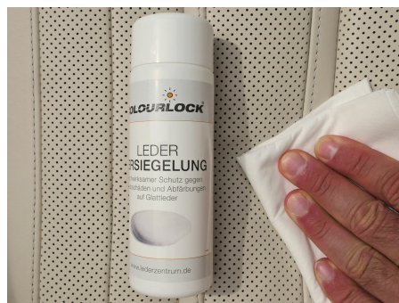
Die COLOURLOCK Leder Versiegelung schützt neue Leder vor Verschleiss und Gebrauchsspuren.