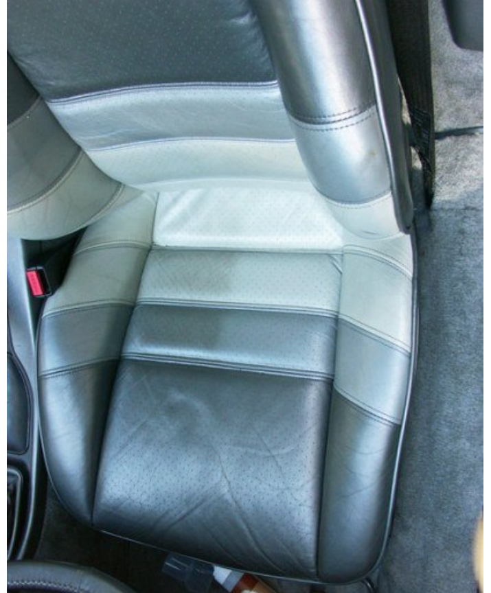
Leder mit einem Metallceffekt bei Porsche