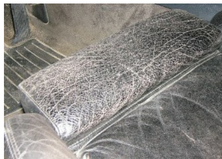
Stark brüchige Autoleder.