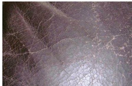
Ältere und stark brüchige Möbelleder.