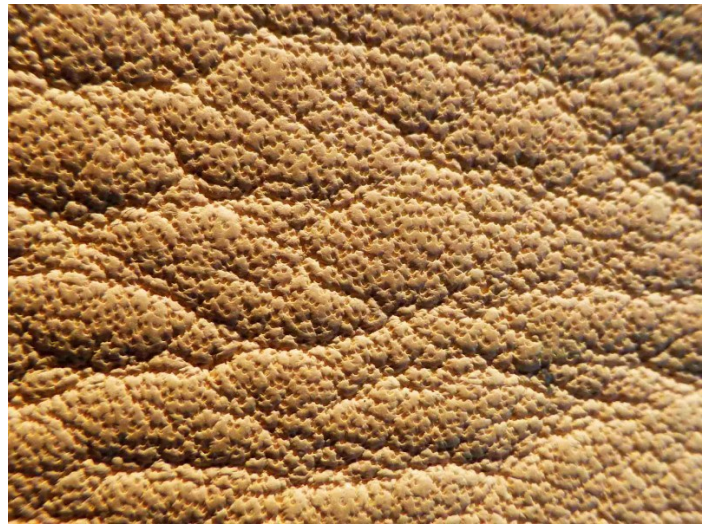
Ein sehr grobporiges Anilinleder.

Bei den feinporigen Ledern wird die COLOURLOCK Aniline Cream angewandt. Dieses Produkt ist ein Intensivschutz für die feinporigen Anilinleder, das bei regelmässiger Anwendung eine starke Imprägnierwirkung gegen alle Arten von Flecken und Anschmutzungen bietet. Wichtig: Nur ein von Anbeginn durchgeführter Schutzauftrag schützt vor Flecken. Bereits eingezogene Flecken lassen sich meist ohne einen Fachbetrieb nicht mehr entfernen. Daher ist die Prävention sehr wichtig.