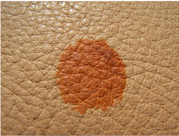
Sehr offenporig und empfindlich.

Leder ohne jede Schutzschicht sind besonders fleckenempfindlich. Insbesondere hellere Farben. In solchen Fällen ist die COLOURLOCK Imprägnierung die erste Wahl. Das gilt auch für besonders grobporige Leder.