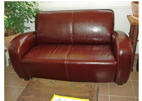
PU-Leder sehen Fettledern ähnlich, haben aber eine Beschichtung und sind aus Spaltleder.

Neue Fettleder oder Pull-Up-Leder sind entgegen der Erwartung meist offenporig. Regentropfen und andere Flüssigkeiten ziehen in das Leder ein und hinterlassen dann Fleckenränder. Der Test ist einfach. Einen Tropfen Wasser an einer verdeckten Stelle verreiben. Zieht der ein und dunkelt das Leder, dann ist es offenporig. Für solche Leder ist die COLOURLOCK Imprägnierung als Fleckenschutz die beste Erstpflege. Bei Fett- oder Pull-Up-Ledern, wo ein Tropfen Wasser nicht eindringt, ist die COLOURLOCK Aniline Cream die erste Wahl. Im Gegensatz zur Imprägnierung ist bei den Creme-Varianten der Ausgleich von Gebrauchsspuren stärker. Bei offenporigen Fett- oder Pull-Up-Ledern kann das aber zu fleckigen Ergebnissen führen. Im Zweifel ist daher die Imprägnierung die erste Wahl für die Alltagspflege.