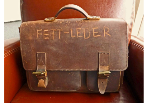
Fett- und Pull-Up-Leder haben eine Patina, die sich im Gebrauch verstärkt.

Bei Fettledern ist die Narbung erhalten, wogegen bei Pull-Up-Ledern die Narbung in der Herstellung angeschliffen wurde. Fett- und Pull-Up-Leder gibt es in den verschiedensten Ausführungen. Glatt oder grobnaarig und von matt bis glänzend. Kennzeichnend für die Leder sind eine Patina-Optik, das leichte Entstehen von Gebrauchsspuren durch Kratzer und die leichte Abfärbung beim Abreiben mit einem angefeuchteten Lappen. Die Abfärbungen entstehen, weil die verwendeten Öle und Fette für die Oberflächenbehandlung eingefärbt sind.