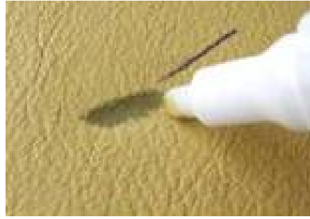
Bei älteren Strichen reibt man schnell die Farbe des Leders mit ab.