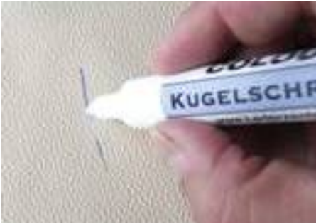
Frische Kugelschreiberstriche lassen sich noch leicht entfernen.

- Gereinigte Bereiche nach der Säuberung mit Leder Versiegelung neu schützen.