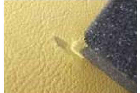
Solche Stellen müssen dann mit Leder Fresh farblich angeglichen werden.