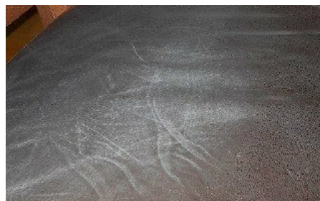
Haut-/Haarkontaktbereich, matt und klebrig