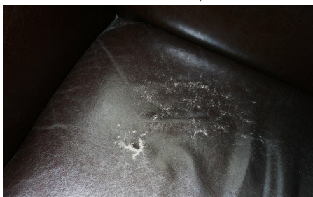
Belastungsbereich, eingerissen und brüchig