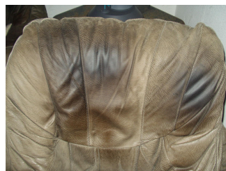
Sehr speckiges Leder: Fettlöser-Spray versuchen