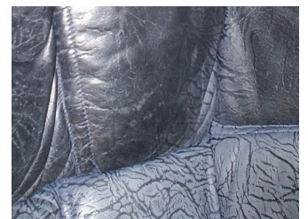
Extrem speckig: Fragen Sie einen Fachbetrieb