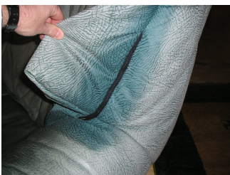
Stark ausgebleichenes geprägtes Nubukleder: Fachbetrieb fragen

Bei stärkeren Ausbleichungen und zu starken Verschmutzungen sollte man eine Fachwerkstatt konsultieren. Extremfälle sind aber nicht rettbar. Fragen Sie uns nach einer kompetenten Firma.