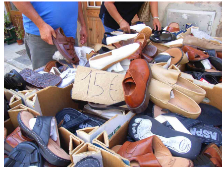
Billigschuhe auf dem Marktplatz.