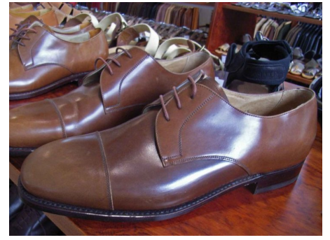
Schuhe aus offenporigem Anilinleder.

Weidmann & Sohn - COLOURLOCK Kundencenter Tämperlistrasse 3 - CH-8117 Fällanden Tel.: 0840 820 820 - Fax 044 730 45 02 - e-mail: info@lederzentrum.ch Öffnungszeiten: Mo. - Fr., 8 - 17 Uhr