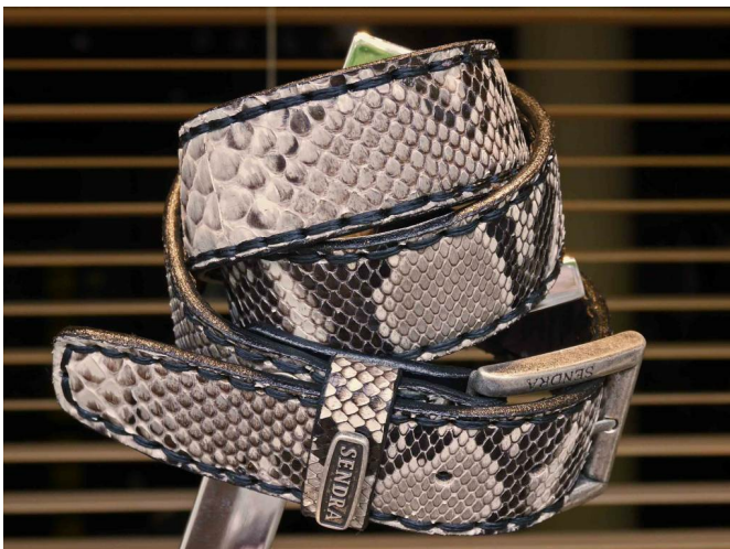
Schlangenleder, nur nach Absprache mit einem Fachmann behandeln