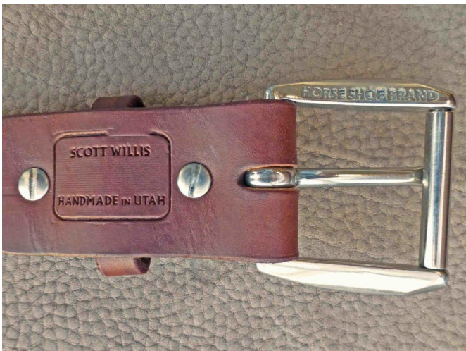
Robustes Leder, unkompliziert zu handhaben

Manchmal färben Gürtel ab. Diese sollte man dann auf den abfärbenden Seiten mit COLOURLOCK Leder Fixativ mehrfach feucht abwischen. Auf der glatten Seite das Leder anschliessend mit Leder Versiegelung mehrfach einpflegen und zwischendurch mit einem Fön trocknen. Dadurch wird die Neigung zur Abfärbung reduziert. Stark abfärbende Gürtel sind dadurch aber nicht rettbar. Diese sollten reklamiert werden.