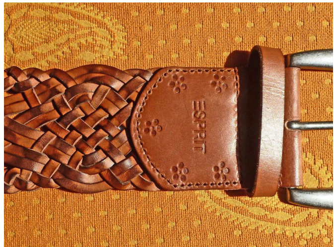
Geflochtenes Leder, Pflegeprodukte erst im Lappen verreiben